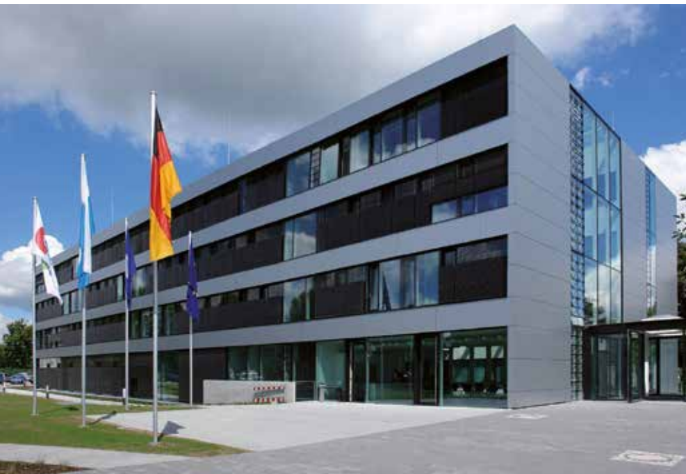
Das Earth Observation Center - EOC - in Oberpfaffenhofen bei München

Im DFD werden zudem die Daten nationaler, europäischer und internationaler Satellitenmissionen empfangen, verarbeitet, archiviert und der Allgemeinheit zur Verfügung gestellt. Hierzu betreibt das Institut nicht nur in Deutschland, sondern auch in der Antarktis und Kanada Empfangsstationen. Dabei kooperiert das DFD international mit Organisationen und Firmen. Aus den Daten werden Geoinformationen abgeleitet, online bereitgestellt und langfristig gesichert. Das DFD arbeitet an Verfahren und Informationssystemen für die Umweltbeobachtung, das Management von Ressourcen, den Katastrophenschutz und die Frühwarnung vor Georisiken.