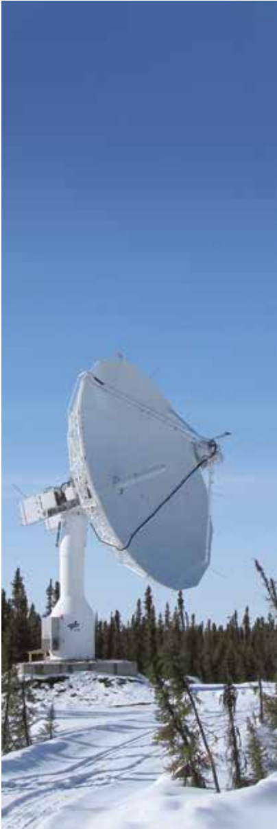
DFD Empfangsantenne in Inuvik, Kanada