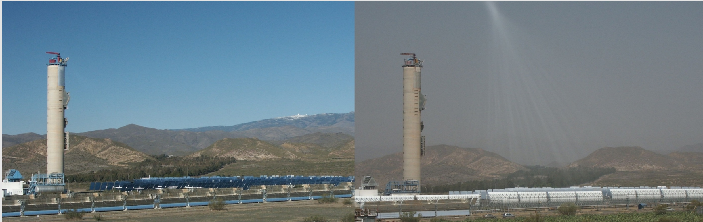
Abb.1: CESA1 Turmkraftwerk an einem typischen klaren (links) und trüben Tag (rechts) auf PSA, Spanien.