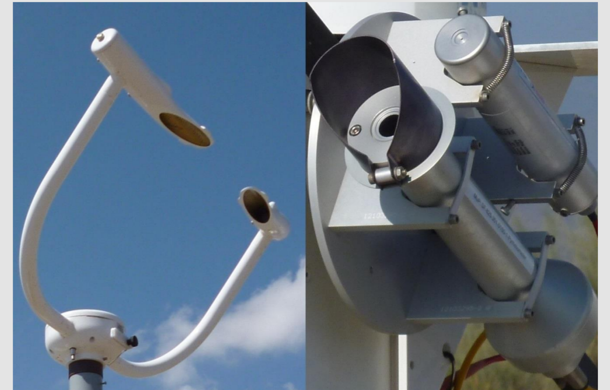
Abb. 2: FS11 Vaisala Streusensor (links), CHP1 Kipp & Zonen Pyrheliometer für DNI Messungen (rechts).