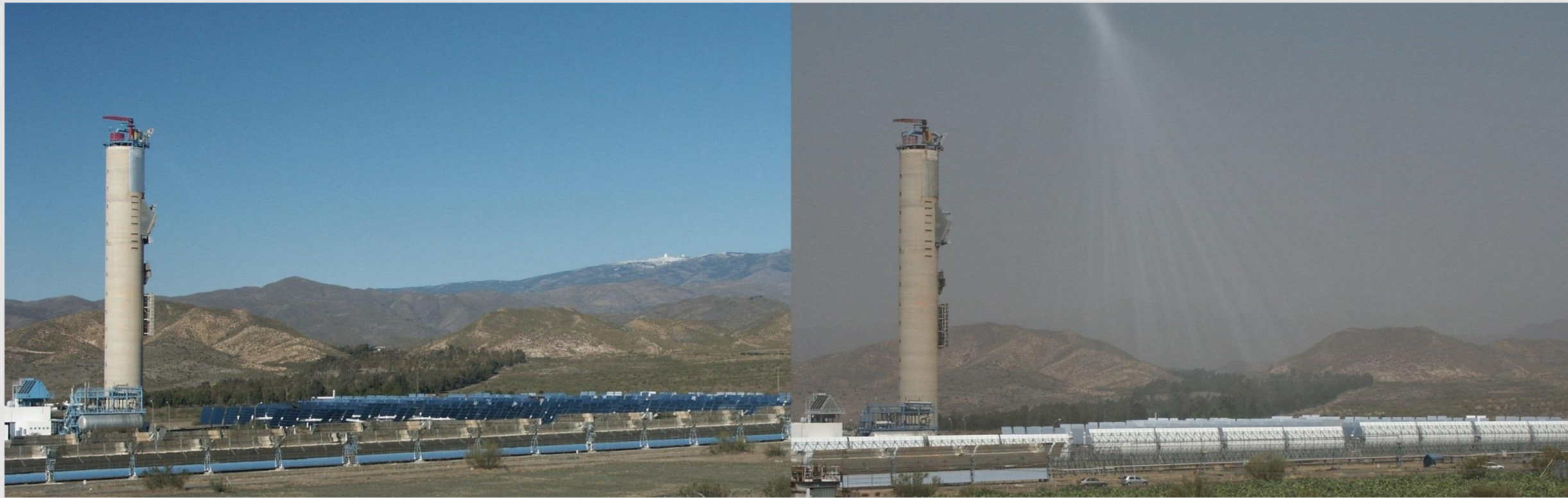
Abb.1: CESA1 Turmkraftwerk an einem typischen klaren (links) und trüben Tag (rechts) auf PSA, Spanien.