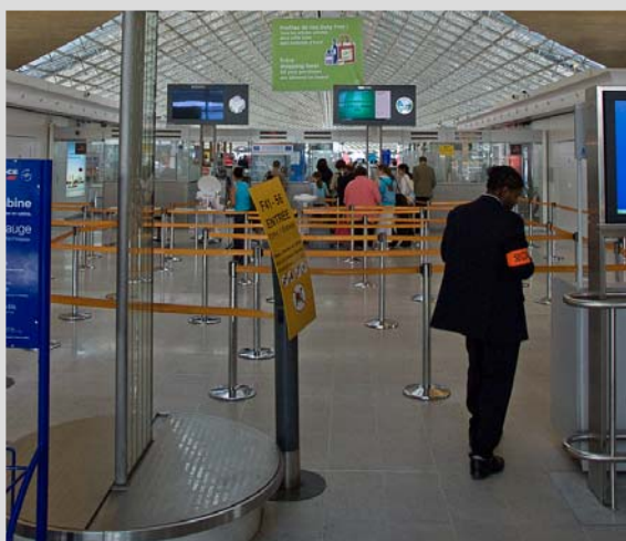
Wartebereich vor der Sicherheitskontrolle