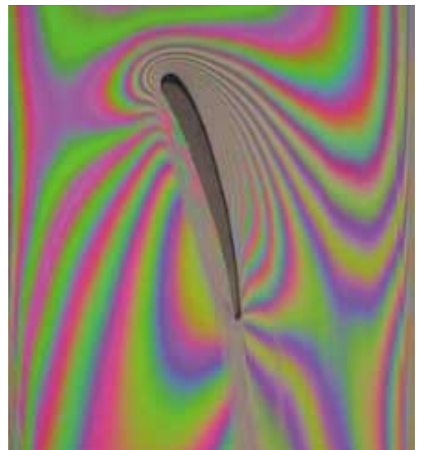
Flügelprofil im Seifenfilmkanal.

Damit haben die Wissenschaftler eine einfache Methode entwickelt, das Strömungsverhalten um interessante Körper sehr schnell untersuchen zu können. Diese Methode der Strömungssichtbarmachung selbst auszuprobieren und sogar eigene Profile untersuchen zu können, ermöglicht dir das Experiment Seifenfilmkanal im DLR_School_Lab.